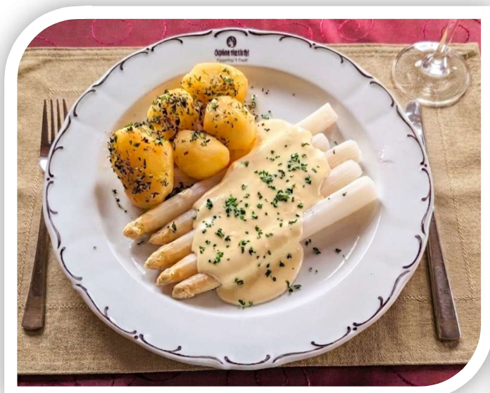
Frischer deutscher Spargel

mit Petersilienkartoffeln und Sauce Hollandaise